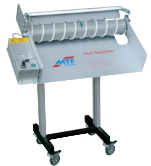
MTF Multi-Separator MS-600