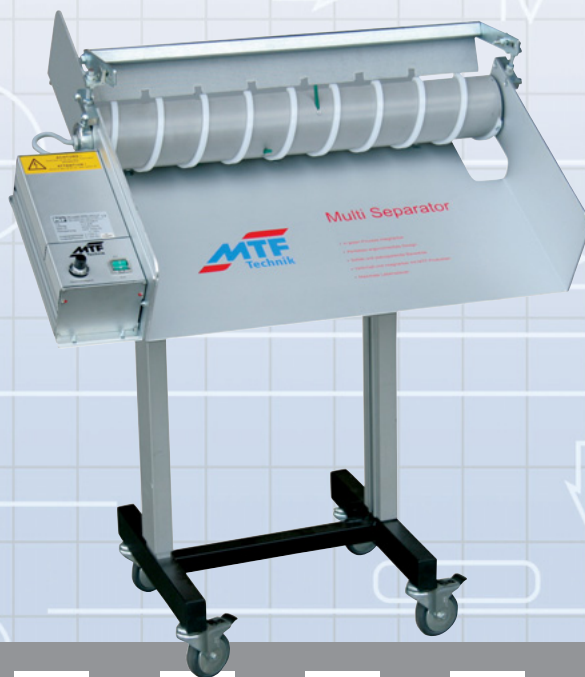
MTF Multi-Separator MS-600